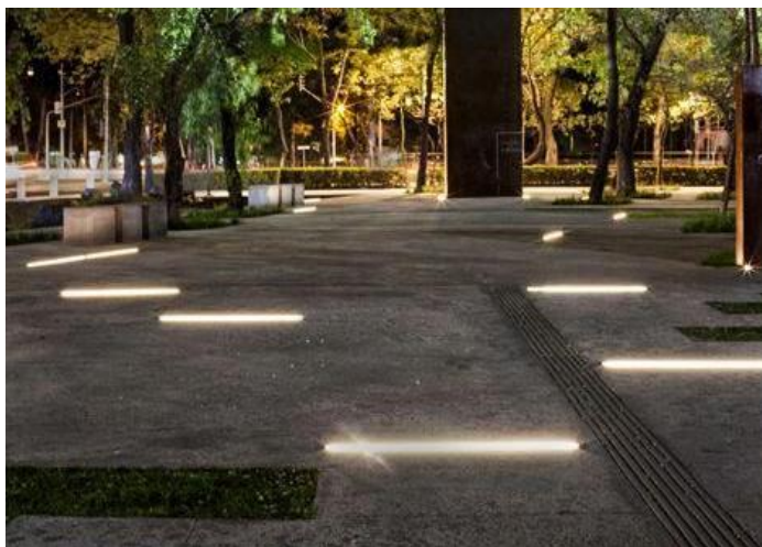
Šviesos juostų analogas grindinyje