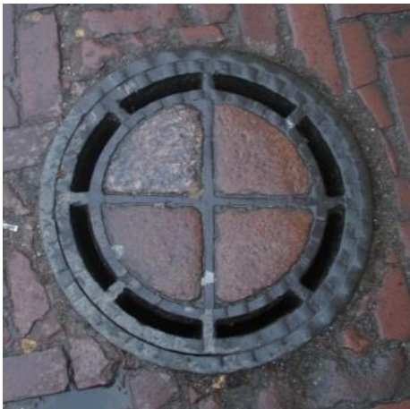
Naujai keičiamų šulinių dangčių analogas.

Projekte numatytas centrinėje terasos aikštelės dalyje esančių šulinių dangčių keitimas į jų paviršius integruojant rusvai rausvo granito plokšteles.