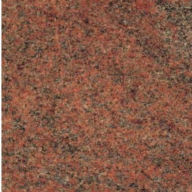
Rudai rausvas granitas

Elektros sistema įrengiama po akmens grindinio paviršiumi, numatytos lauko sąlygoms tinkančios ekonomiškų LED šviestuvų juostos.